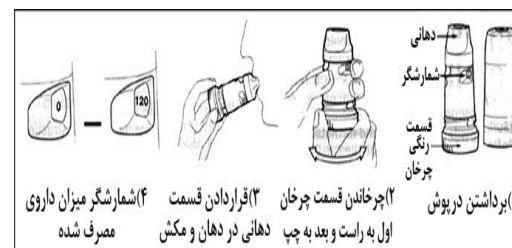
شکل ۵ - نحوه استفاده از توربوهاالر دارویی (سیمینگورت، پالمیگورت، اکسیس)